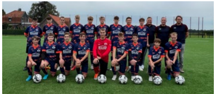
In Reih und Glied posierte die Mannschaft zu Beginn der Saison professionell für ein Mannschaftsfoto...